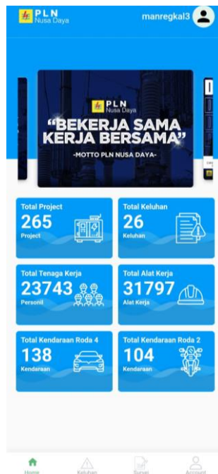
Gambar 2. 1 Halaman Dashboard

Setelah login, pengguna dapat melihat total jumlah project, keluhan, tenaga kerja, alat kerja, kendaraan roda 2 dan kendaraan roda 4 sesuai dengan region dan atau area pengguna. Pada halaman dashboard.